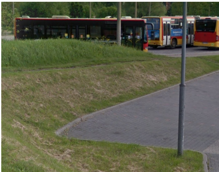
Fot. 1. Teren pod inwestycję.

Projektowany obiekt posadowiony zostanie na działce 1217/46. Obecnie na przedmiotowej działce znajduje się zieleniec, tj. urządzony teren zielony.