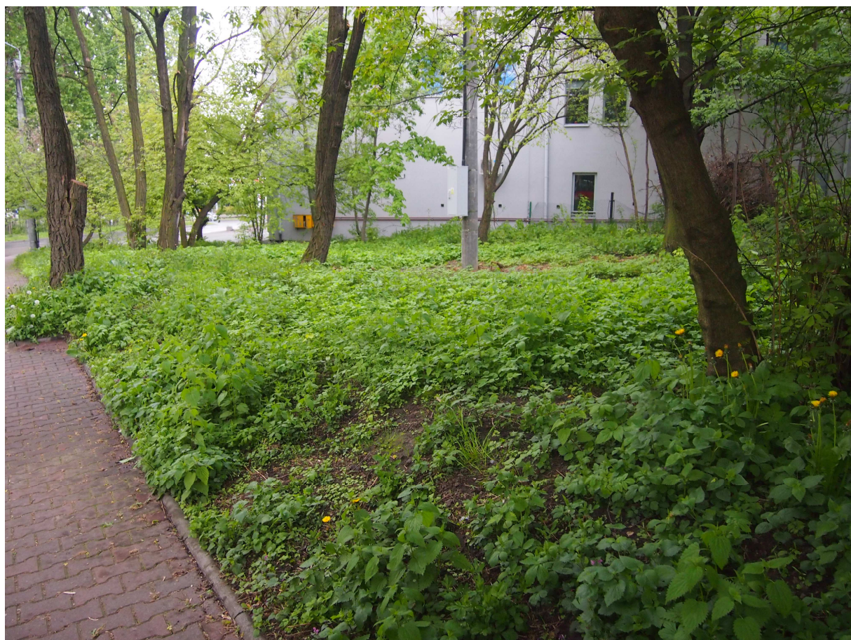
Fot. 1. Teren pod inwestycję.

Projektowany obiekt posadowiony zostanie na działce 22/2. Obecnie na przedmiotowej działce znajduje się zieleniec, tj. urządzony teren zielony, planowany do przebudowy.